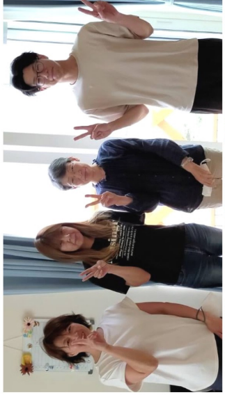
▲明るく優しいスタッフの皆さん。夜勤は1名体制です