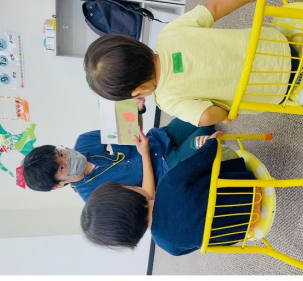
▲楽しく絵本の読み聞かせ

「ご家族だけで抱え込まず、まずはご相談ください。利用者、スタッフともに募集中です!」とのこと。