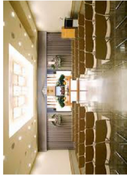
▲200名収容可能な大ホール

す。他にも成人式、卒業式の衣装レンタルやウエディング、二次会のパーティドレスレンタルなど、会員限定のお得なプランもいっぱい。斎場というと日常的に利用する施設ではないため、気後れする方も多そうですが、ご要望や質問があれば問い