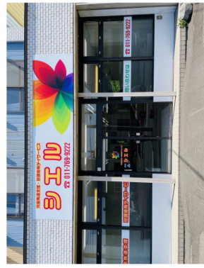
▲横新道沿い、駐車場もあります。