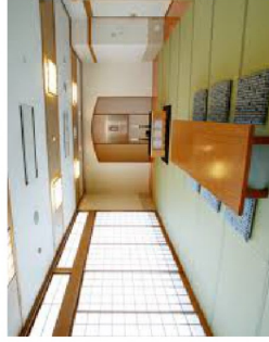
▲家族待機室は落ち着きのある空間

合わせて欲しいそうです。 住所：篠路8条5丁目3-1 お問い合わせ：771-14422