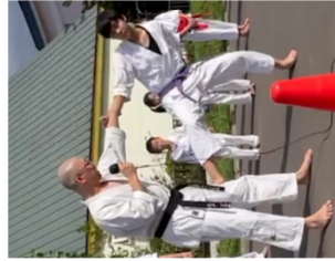
▲掴まれた場合の対処法の実演と解説

有意義では」と考え、今回の演目となったそうです。当日は猛暑の中、多くの観客の前で、小学1年生～大人までが護身技の演武や板やブロックの試し割りを行い、観客からは大きな拍手と歓声が送られ、門下生の保護者からは「一所懸命な姿に感動した」との感想が聞かれました。