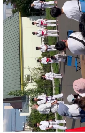
▲気合溢れる試し割りでは、割れる度に会場も大盛り上がり！

コウ武流空手 毎週木曜 18時半～20時半 屯田地区センター 毎週月曜 19時～21時 東区体育館他 打ち合気あらい道場 毎週火曜 18時半～21時 篠路コミュニケーションセンター