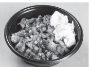
▲テイクアウトのホルモン丼(500円)

▼住所：篠路3条6丁目4-2 ▼電話：772-9791 ▼営業時間：午前11時30分〜午後2時30分 午後4時30分〜10時30分 ▼定休日：水 ▼HP：http://ichiban-kan.com