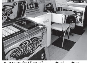
▲1970年代のジュークボックス

るようでなかなかない!」そう、長自らアレンジした手作りアメリカン雑貨もあります。 店長いわく「アメリカン雑貨は札幌はおろか北海道にもあ