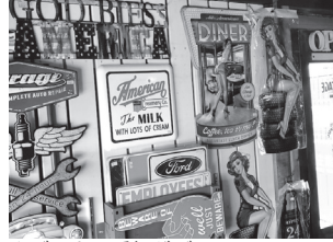
▲ブリキの看板がズラリ