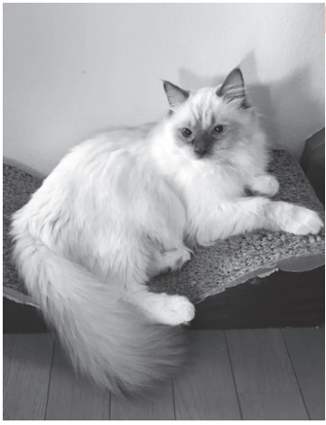
▲伊之助くん(ラグドール猫) 爪とぎソファが大好き

我が家のペットを掲載したい方は編集部まで。ペットの種類は問いません。皆さんのペット自慢、どうぞお待ちしております！