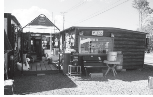
▲店長手作りの木造ハウス