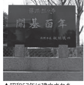
▲昭和57年に建立された 「開基百年碑」

篠路村烈々布は、現在の百 合が原地区の旧名です。「れ つれつぶ」という語源につい ては、アイヌ語に由来すると 言われていますが、定かでは ありません。 篠路村本村(現在のJR 篠路駅周辺)の入植が始まっ たのが幕末であるのに対し、 同じ篠路村でも南端に位置す る烈々布の開拓が始まったの は、約25年も経った頃でした。 福岡県から篠路村本村に集団 入植した人々のうち、5〜6 戸が本村からこの地に転住して 集落を形成したのです。 この明治16年が、烈々布開基 の年と定められています。 その時、入植した人々はやが て全員が烈々布から去っていき、 その後、明治21年になると、新 街道(現在の石狩街道)が開削 されたことで、陸路の不便さが 若干解消され、烈々布への入植 者も増えていきます。 新しい入植者は、明治23年か ら30年の間に、富山、福井、山 形から続々と移住し、村の基盤 を築きました。百合 が原地区には現在も その時の子孫が数多 く暮らしています。 そして、住民同士結束し、 厳しい開拓生活を乗り越える ために、彼らの母村にあった 郷土芸能をここでも発生させ ました。それが、篠路歌舞伎 と篠路獅子舞だったので