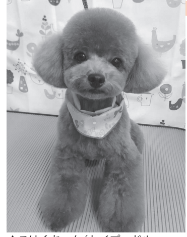
▲こはくちゃん(トイプードル 2歳♀) とっても甘えん坊。 ブロッコリーが大好きです

我が家のペットを掲載したい 方は編集部まで。ペットの種類は 問いません。皆さんのペット自慢、 とどしどしお待ちしております！