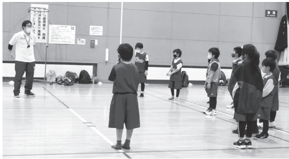
▲指導員の話真剣に聞く子供たち

▼時間：毎週水または金 1部 午後3時20分～4時20分 2部 午後4時30分～5時30分 ▼対象年齢：幼稚園年中～小学 6年生 ▼問い合わせ：0120- 834-802（ハーツ本部）