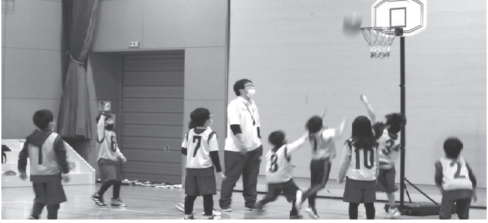
▲試合形式で楽しく練習

「チョットお助けサービス」 70歳以上のお客様を対象に、販売所所員が電球交換などチョットしたお手伝いをします。詳しくは販売所までお問合せください。