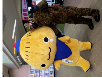
▲たまちやんと自衛官さん