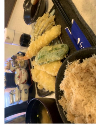
▲お好みの盛り合わせ

住所: 屯田1条3丁目5-13 お問い合わせ 電話: 555-1298 営業時間: 月～金: 放課後～午後6時30分 (土日祝、長期休みは 午前11時～)