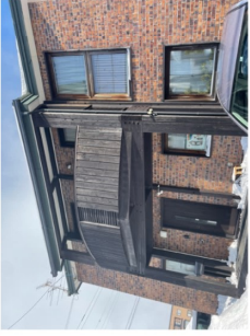
▲ロクハウス風の素敵な建物