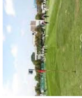
▲長年にわたり愛された パークゴルフ場

常時受け付けています。クーポンやお得な情報もLINEで配信中! 住所: 太平9条4丁目 電話: 772-9185 営業時間: 【平日】 午前11時～午後3時 午後4時30分～8時 【土日祝】午後9時まで (全日ラストオーダーは 閉店30分前) 定休日: 水曜、不定休