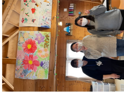
▲元気いっぱいスタッフ