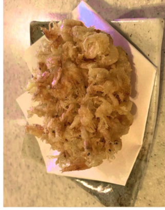
▲桜エビのかき揚げ