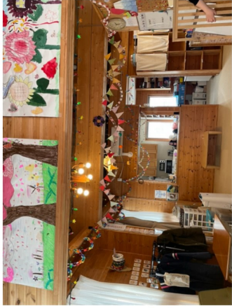
▲子どもたちの作品が飾られる 温かい雰囲気の室内

っているため、学習室や音楽室での楽器演奏、絵や工作などの創作活動など好きなことに取り組むことができ、「考える力」が身につきます。また、週末には外出しクリエイションも行っており、石狩図書館、石狩鮭まつり、由仁町の酪農家のもとを訪ねたりと、子どもたちの情操を育てるイベントを開催していま