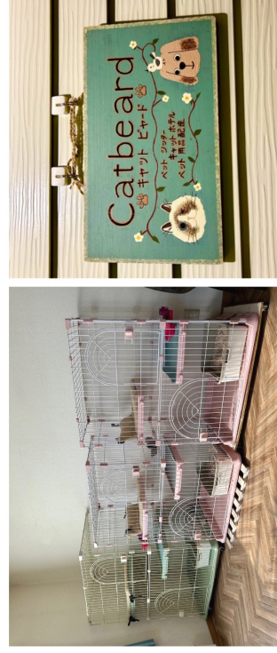
▲キャットホテル。ゲージも清潔で安心。 ▲可愛い看板が目印です。