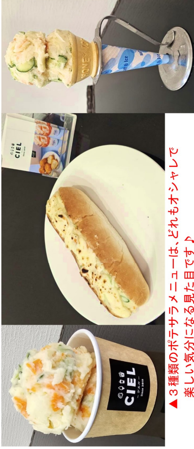
▲3種類のポテサラメニューは、どれもオシャヤレで楽しい気分になる見目です！

住所：太平7条5丁目2-5 (ラーメンけせらせらさん隣) 営業時間：午前11時～午後7時 定休日：不定休 お問合せ：790-8813