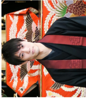
▲今回の催しを企画した光顕副住職

普段見る事のない納棺師の儀式と、近年話題の相続のトラブルについて知れる機会に宗派・檀家を問わずどなたでも参加出来るので、興味のある方は教願寺に足を運んでみてはいかがでしょうか？