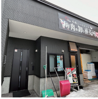
▲左側の玄関が入口です

個人の住宅のような玄関を入り、靴を脱いで部屋にあがると一面に立ち並ぶ冷凍庫。この中に自社工場で作られたお肉が並べられています。こちらの会社は海と山の大自然の中で牧場を営んでおり、ストレスなく丹精込めて育てた八雲牛を札幌のこちらの工場で作品加工しています。