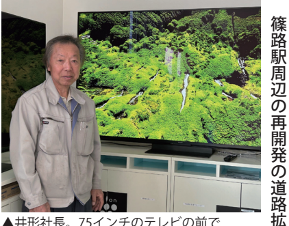
▲井形社長。75インチのテレビの前で