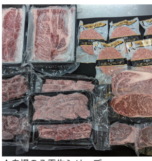
▲自慢の八雲牛シリーズ

個人の住宅のような玄関を入り、靴を脱いで部屋にあがると一面に立ち並ぶ冷凍庫。この中に自社工場で作られたお肉が並べられています。こちらの会社は海と山の大自然の中で牧場を営んでおり、ストレスなく丹精込めて育てた八雲牛を札幌のこちらの工場で作品加工しています。