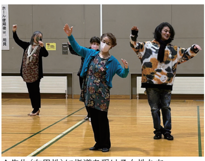
▲先生(右男性)に指導を受ける女性たち

社交ダンス同好会は、篠路コミセンの各サークルの中でも歴史が古く、最盛期には120名もの会員がいたそうですが、コロナ禍以降人数が減り、現在は男性5人女性5人。年齢層は60代〜70代で、熟練者もいれば初心者もいます。