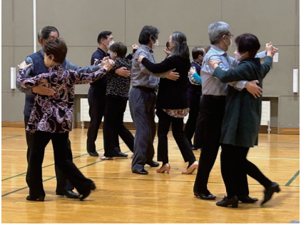
▲男女ペアになってステップ

70歳以上のお客様を対象に、販売所所員が電球交換などチョットしたお手伝いをします。詳しくは販売所までお問合せください。