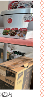
▲オープンしたばかりの店内

が、大型家電量販店ではできないきめ細やかなサービス。また、電気屋さんには珍しい業務用のエアコンも扱っているため、店舗などで使用したい方にはオススメです。店頭には商品は取り寄せも可能です。家電のリサイクル処分も行っているため、家電でお困りごとは井形電気にご相談ください!