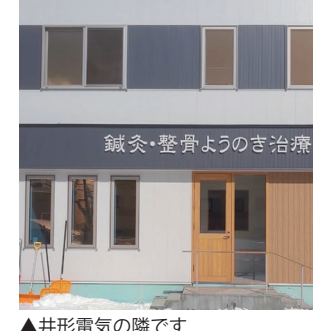
▲井形電気の隣です