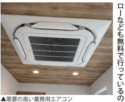
▲需要の高い業務用エアコン

井形電気商会 老舗の電気屋さん 張のため、このたび旧店舗左側に移転し、3月末からリニューアルオープンしました。業務内容は、電気工事の他水道工事、住宅設備、リフォーム、給湯・暖房ボイラー、パソコンのトラブルなど、幅広いお困りごとに対応。お客さんの中でもパソコンの操作に不安がある方には、初期設定やアフターフォローなども無料でやっているの