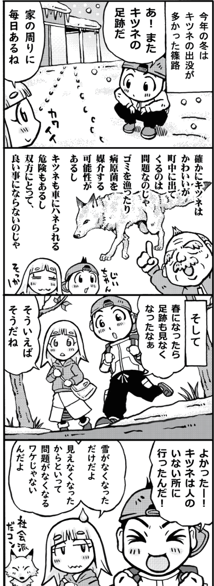
季節と共に少し成長したユリであった。詳しくは百合が原公園HPを確認